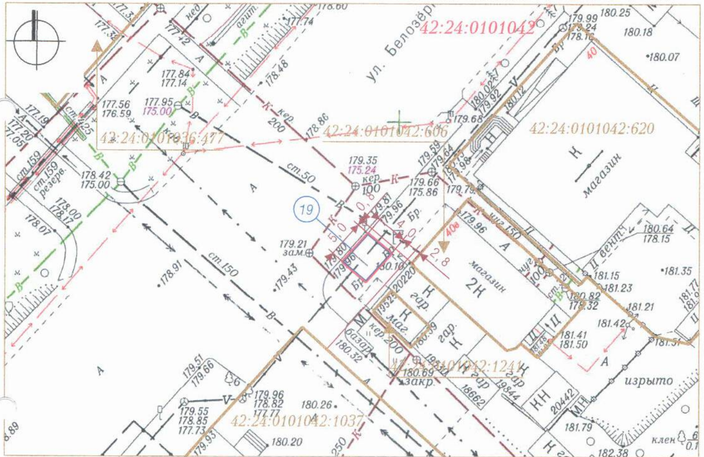
СХЕМА РАЗМЕЩЕНИЯ НЕСТАЦИОНАРНОГО ТОРГОВОГО ОБЪЕКТА, ГРАФИЧЕСКОЕ ИЗОБРАЖЕНИЕ М 1:500